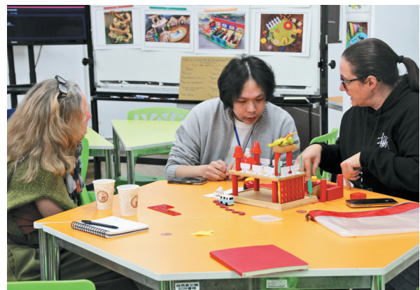
3 月 15 日工作坊中，我國學生與國際與會者相互交流，分享如何為家庭提供開放式遊戲與實務經驗，展現多元觀點