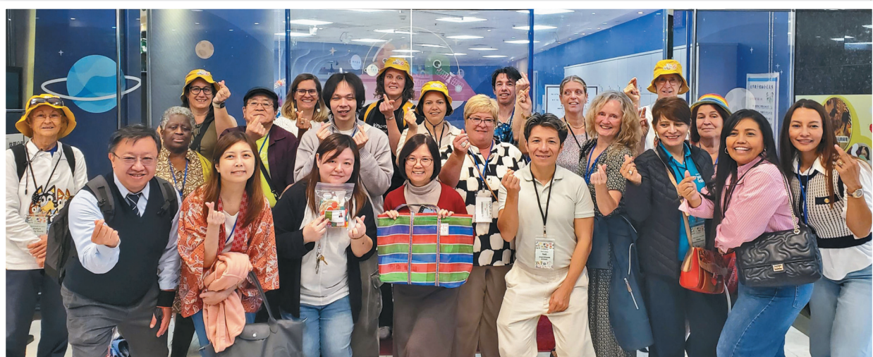
3月16日臺北市中正親子館參訪，帶領國際友人認識我國兒童館設於數位遊戲的實際應用與規劃