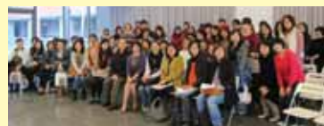
● 102年11月26日北區國中視覺藝術領域教師參觀「初心·頂真—當代工藝展」與計畫主持人林曼麗教授合影。

教育部為推動美感教育，委託本校 MoNTUE 北師美術館辦理「北區美感教育大學基地學校計畫」，及教育學院辦理「中小學師資培育課程之視覺形式美感教育課程建構計畫及各級學校視覺形式美感素養調查分析計畫」。前者計畫結合 MoNTUE 北師美術館展覽資源，將遴選及培訓中等學校種子教師，輔導種子學校課程實驗，亦招募大學生參與社區美感教育實作，落實