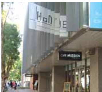
● Café Mussion座落在綠樹環抱的北師美術館內

全民美育；後者將以研究調查分析的方式，建構現行師資培育之視覺形式美感課程，以及建立中等學校學生美感素養常模，作為未來相關研究報告之參考依據。