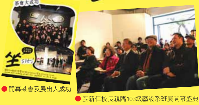
●開幕茶會及展出大成功

此次展出最特別的地方在於將兩個性質如此不同的設計：椅子與工藝，融合於展覽中表現出來，帶給觀展人以廣泛多元的角度欣賞設計之美，不侷限界線，讓設計與人的對話更具創造性！