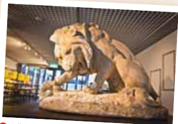
●《獅子與毒蛇》表現出動物塑像的戲劇性

毒蛇，表現出戲劇性的一刻。除了生動的動物塑像外，在美術館內還可以發現許多以宗教為題材的雕像，例如位於一樓櫃台上方的《天使報喜》，即為聖經故事中大天使加百利前來告知聖母瑪利亞她已受聖胎即將生下耶穌的情節；而在即將開幕的美術館咖啡廳內，可以看到由3個浮雕組合而成的場景，即是聖母之死與聖母升天的故事，在兩旁為《聖母之死》中哀悼的使者，呈現出悲傷卻不失莊嚴畫面，而中上方則為充滿喜樂氛圍的《聖母升天》浮雕。除此之外，在樓梯的