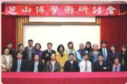
●「2012芝山博學術研討會」圓滿成功

101年12月8日芝山博學會與本校教育經營與管理學系於科學館辦理「2012芝山博學術研討會」，邀請國立臺灣師範大學教育學系許添明教授進行專題演講，講題為「失落的一角：由教育財政角度看教育政策」，透過本次演講，與會人員瞭解到財政實務上，教育政策的施行與困難。本研討會舉行四場共13篇論文發表，由林新發教授、鄭崇趁教授、曾錦達教授與林曜聖教授進行評論與指教。最後在本系孫志麟主任主持下，發表人與師長們熱烈交流與討論，為研討會劃下圓滿句點。