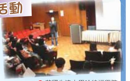
●英國牛津大學哈特福學院研習團行前說明會

今年暑假將辦理兩梯次的研習活動，分別為7月20-29日赴韓國首爾教育大學十天的文化研習團，及8月14日至9月2日赴英國牛津大學哈特福學院與倫敦地區二十天的語言與文化參訪研習活動。英國牛津大學哈特福學院研習團為首次辦理，本次赴英國將與該校簽訂三年期的研習活動交流合作協議。