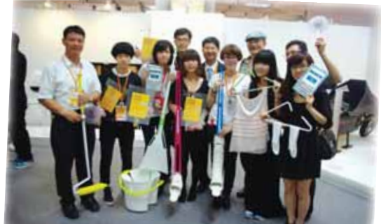
●獲獎同學拿著作品與校長及師長合影

本校藝術與造形設計學系設計組畢業班同學參加2011年新一代設計展，並在新一代設計競賽中入圍「產品設計類」五件、「包裝設計類」一件；其中產品設計類更獲得一金、一銀、二銅、一廠商獎之殊榮，於5月22日（日）接受頒獎。