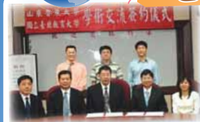
●山東魯東大學李清山校長一行蒞校訪問

山東魯東大學李清山校長一行三人於今(100)年4月20日(三)蒞校訪問，並同時簽訂兩校學術合作交流備忘錄。5月間，本校與英國里茲大學完成兩校交流備忘錄之續約，