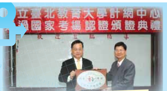
●考選部賴峰偉部長親自蒞校授證

本校在計算機與網路中心及各行政單位，包含總務處、傳科所、資料系、數資系、圖書館的通力合作與資源整合下，通過國家考試電腦化測驗試場認證，是北部第一所通過此認證的國立大學，代表本校在網路與設備管理上，達到高效能、零故障的高標準管理，深受肯定。