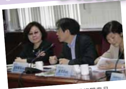
●校外委員提供本校評鑑相關意見

為配合今（100）年下半年度財團法人高等教育評鑑中心大學校院評鑑工作，本校於5月18日舉行校務自我評鑑及三項專案（體育類、性別平等教育、校園環境與安全管理）自我訪視作業。感謝各單位鼎力相助，行政團隊通力合作，及接受晤談教師、學生、行政人員之全力配合，自我評