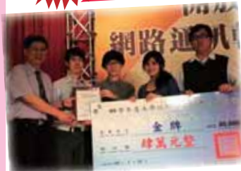
●「動作品「bottlenet2011」勇奪「行動終端應用組」金牌