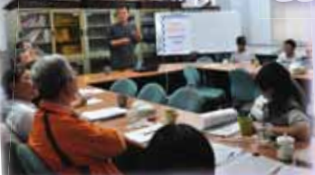
●王保進教授演講「教師教學與學生學習成效品質保證之機制」