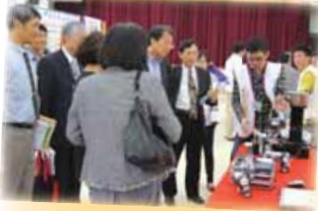
●資料系向來賓展示「機器人作品實現感測器的應用」